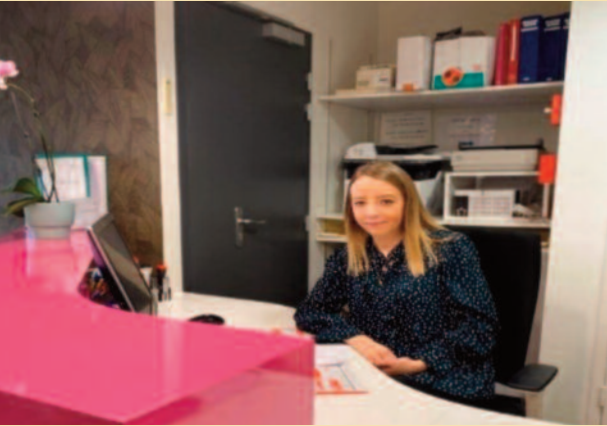
Stage en EHPAD