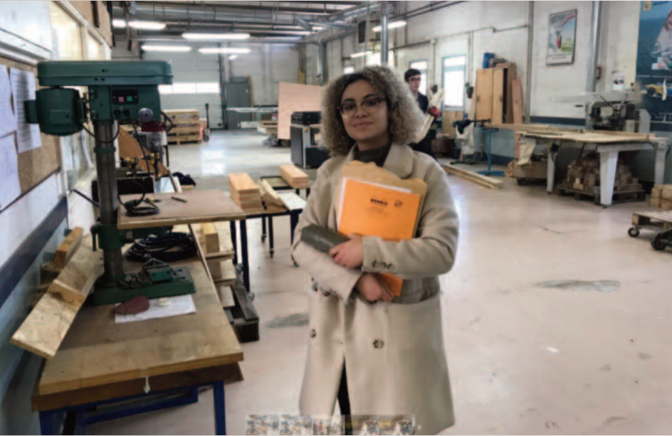
Mon stage de 2 ème Année à L'ESAT de Cesson Sevigné : Etablissement Spécialisé d'Aide par le Travail